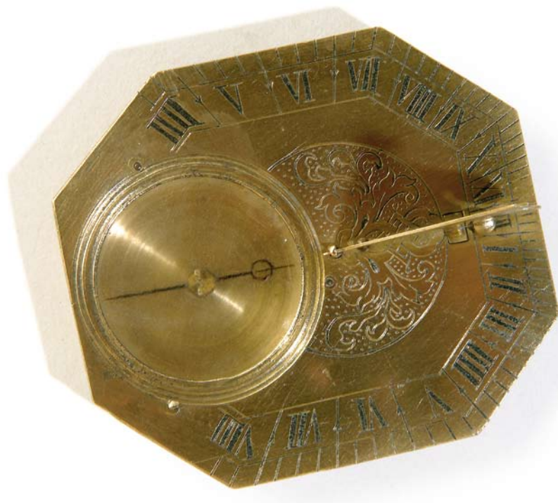
Cadran solaire portable, XVIII e siècle, en laiton.

Une exposition sur les instruments scientifiques de la mesure du temps sera inaugurée lors de Cluses O'Clock , avant d'être accueillie par le musée de l'Horlogerie et du Décolletage.