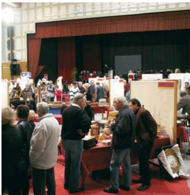
Vue générale du salon 2006.

Entrée libre et gratuite pour tous les visiteurs.