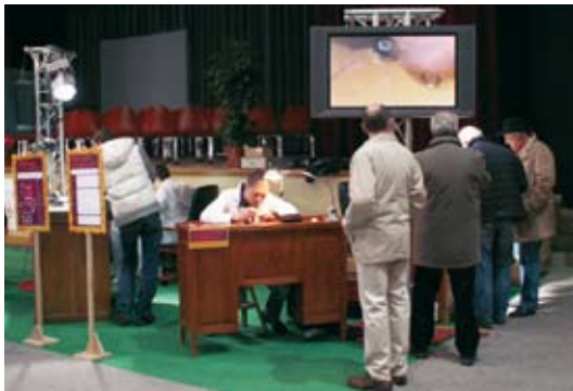
Ateliers de démonstration