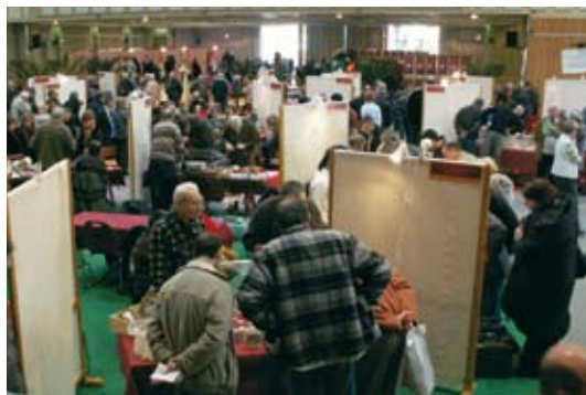
Parvis des Esserts.