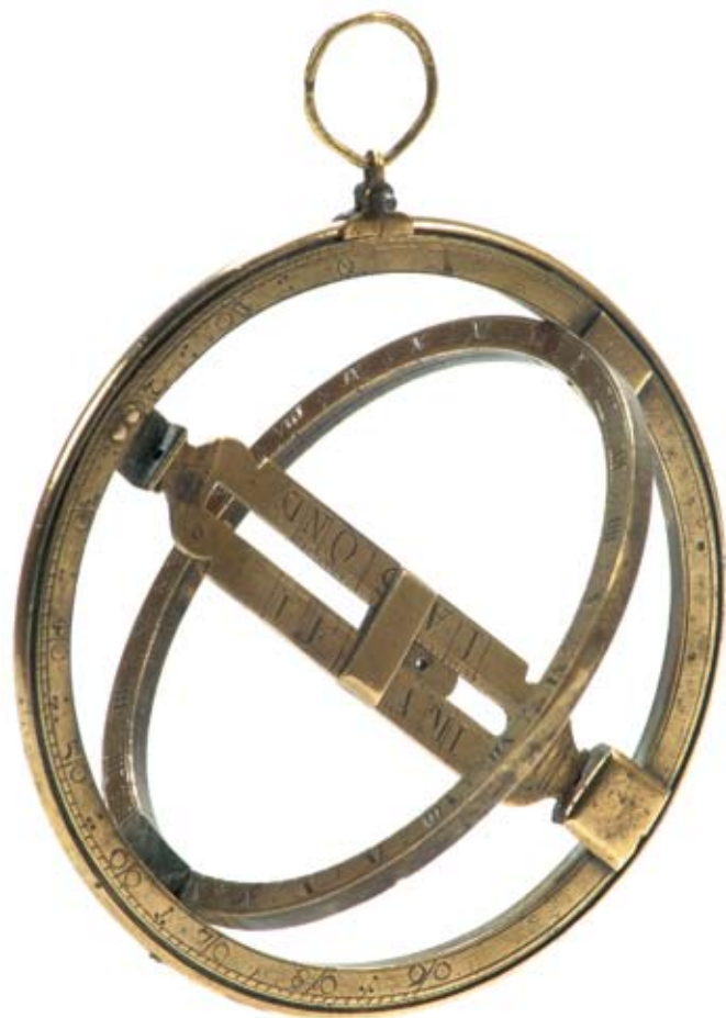
Anneau solaire, xviii e siècle, probablement France.

Ce livret vous présente Cluses O'Clock , une manifestation autour du temps unique en son genre, organisée autour d'une bourse horlogère.